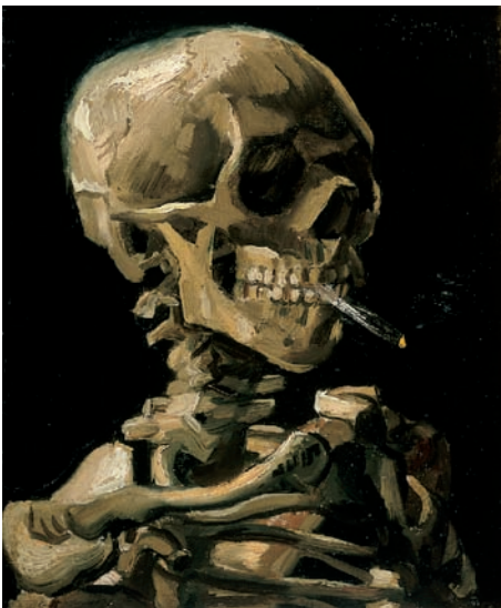
Abb. 1.4. Vincent van Gogh: Schädel eines Skeletts mit brennender Zigarette (1885/1886)

Im Jahre 1821 beschrieben der Mediziner Posselt und der Chemiker Reimann ein milchiges Destillat von frischen und getrockneten Tabakblättern [23] und 1828