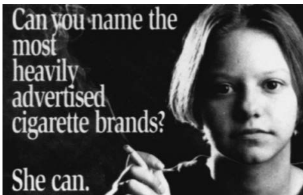
Abb. 1.5. Beispiel für die verdeckte, aber unverhohlene Werbung der Tabakindustrie, die sich an Jugendliche richtet

Im Jahre 1927 konsumierte mehr als die Hälfte der Raucher in den USA Zigaretten, insgesamt 97 Mrd. Stück. Im darauf folgenden Jahr waren es 106 Mrd. Zigaretten (s. Tabelle 1.1). Dies führte schon seinerzeit zu Erkrankungen größeren Ausmaßes. In Großbritannien wurden bereits 1920 Daten über das Auftreten von Lungenkarzinomen registriert. Unklar war damals noch, ob neben dem Rauchen ein zweiter wesentlicher Faktor für das Entstehen eines Lungenkarzinoms verantwortlich gemacht werden konnte. Die Tabakindustrie bestritt wider besseres Wissen die Zusammenhänge zwischen Tabakrauch und Lungenkarzinom bis in die 50er-