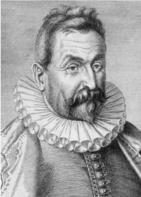
Abb. 1.2. Jean Nicot (1530–1600). Nach einem Gemälde von Hendrick Goltzius [7]

Schnupfpulver verarbeitete und ihrem Sohn Karl IX. gegen seine Kopfschmerzen erfolgreich verabreichte [8]. Der Spanier Nicolas Monardes, Arzt an der Universität zu Sevilla, schrieb 1571 eine Abhandlung über den medizinischen Gebrauch von Tabak, die auch sehr schnell in andere Sprachen übersetzt wurde [9]. Bereits 1590 wurde die Pflanze als Nicotiana bekannt und seit 1828 ist Nicot der Namensgeber für das Hauptalkaloid Nikotin.