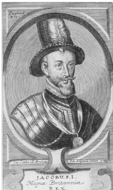
Abb. 1.3. Jakob I., von 1603–1625 König von England [7]

ter“ des Tabakhandels, weil er daraus seit 1614 über Importzölle erheblichen finanziellen Nutzen zog. Dennoch veröffentlichte er 1603 die Schrift „Misocapnus sive de abusu tobacci lusus regius“ (1604 in der englischen Übersetzung „A counterblaste to tobacco“) gegen die Propagierung des Tabaks [13, 14]. Im Vorwort schrieb der König: „Et cum meo iudicio nihil ullibi gentium sit corruptius cerebro hic Tobacci usus, quid apud nos invaluit, absurdum morem scriptiuncula hac perstringere non putavi ab otio meo alienum.“ [13]. Da sich das Tabakrauchen in England zu einem Laster ausweitete, wurde im House of Commons am 16. April 1621 die Verbannung des Tabaks aus der Öffentlichkeit beantragt. Es sei höchste Zeit, so hieß es, da der verderbliche Gebrauch dieser Giftpflanze bereits so allgemein geworden sei, dass man Bauern hinter dem Pfluge rauchen sehen könne [15]. Mit der Beschaffung von Tabaksamen aus Virginia durch die Engländer war das spanische Tabakmonopol gebrochen und Jakob I. unterband die Importe aus Spanien, um die eigene Produktion zu fördern. Nach 1630 wurde aus der Verbotspolitik für Tabakwaren eine Steuerpolitik [16], einer der ersten Versuche einer indirekten Prohibition.