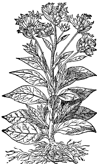
1. Indianische Deynwelle. Nicotiana major .