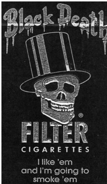
Abb. 1.6. Die Tabakindustrie scheute sich nicht, selbst mit makabren Methoden wie dem „Black Death“ für ihre Produkte zu werben

Die Firma American Tobacco produzierte die Zigarettenmarke Lucky Strike, die zur meist verkauften Zigarettenmarke aufstieg. Mithilfe weiblicher Stars wie der