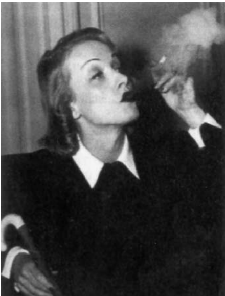
Abb. 1.7. Marlene Dietrich, eine Vorkämpferin für die rauchende Frau

Einen weiteren Aufschwung für die Zigarettenindustrie brachte der 2. Weltkrieg, wobei die bei den Alliierten in Uniform gekleidete Frau zusammen mit den Soldaten entweder Camel oder Chesterfield rauchte. Der Zigarettenverbrauch vervierfachte sich in dieser Zeit weltweit. Nun konnte die Frau ebenso wie der Mann in der Öffentlichkeit rauchend auftreten. Zudem kamen die besonders für Frauen geschaffene „King-Size-“ und Mentholzigarette auf.